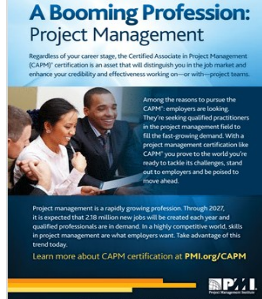
Figura 1 - Promo in PM Network 2018-04

Investire oggi, per trovarsi bene domani!